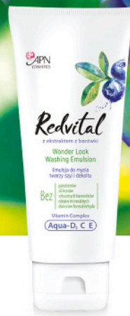
EMULSJA do mycia twarzy, szyi i dekoltu