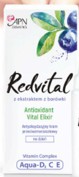
KREM NA DZIEŃ