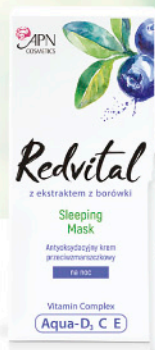
KREM NA NOC